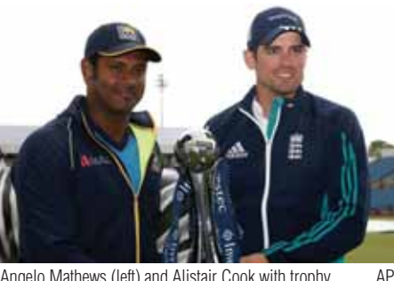
Angelo Mathews (left) and Alistair Cook with trophy