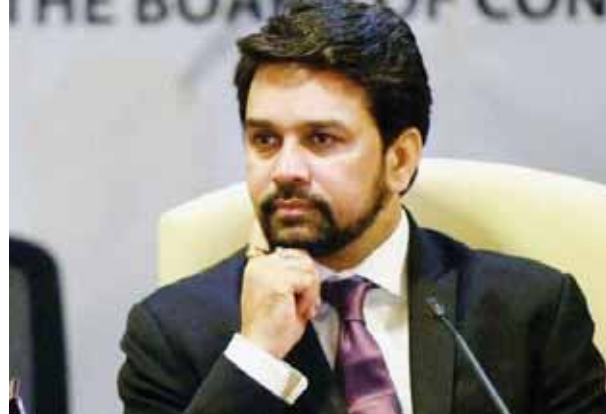
Thakur, who is a BJP MP from Hamirpur is tipped to become BCCI chief after exit of Shashank Manohar who stepped down

The Vacation Bench of Justices Abhay Manohar Sapre and Ashok Bhushan refused to entertain the urgent request by CAB counsel suggesting that the matter should be heard by the special bench headed by Chief Justice of India (CJI) TS Thakur, which is seized of the case relating to reforms in BCCI. The order came as a relief to Thakur as the special bench comprising CJI and Justice FM Ibrahim Kalifulla is likely to be constituted only after the Court reopens by June-end.