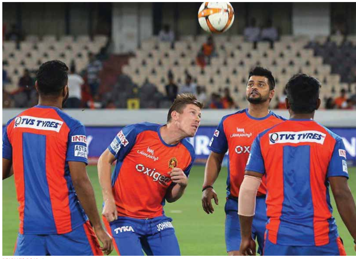
READY TO ROAR: Gujarat Lions players during their training session

Gujarat know they have to pull up their socks in the next tie. Raina's return can be a boon