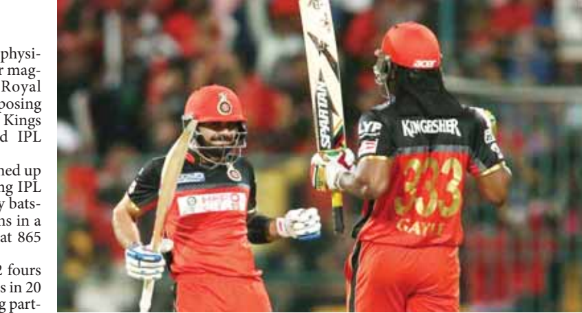
WE ARE CHAMPIONS: Virat Kohli and Chris Gayle do the champion dance on Wednesday

The duo butchered the Kings XI Punjab bowlers with a whirlwind 147-